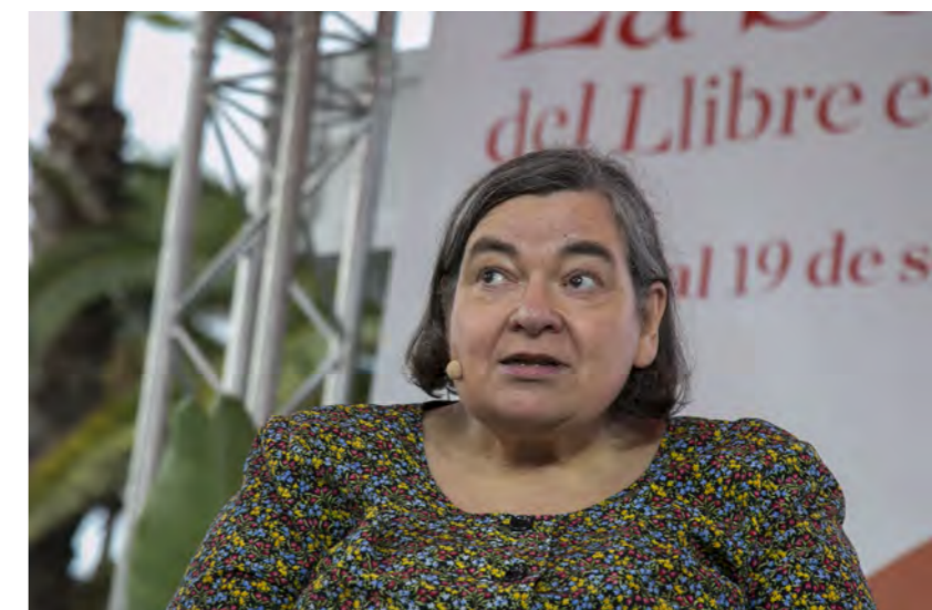
Foto de La Setmana del Llibre en Català, 2021

Llibre: El futur del català depèn de tu (La Campana, 2020)