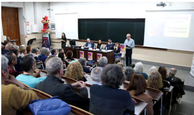
Moment de la lectura del Manifest en l'acte d'inici