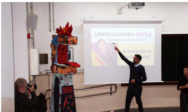
Moment del bateig de la gegantona de la CAL

Durant la celebració també va tenir lloc la lectura del Manifest del Correllengua 2024 a càrrec de l'autor, el filòleg i escriptor Jordi Badia .