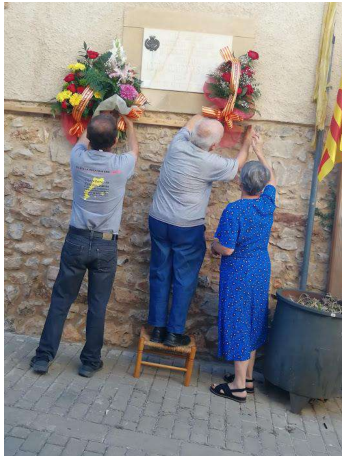
Ofrena floral al c/. de les Roques on havia estiuejat el President Lluís Companys i Jover