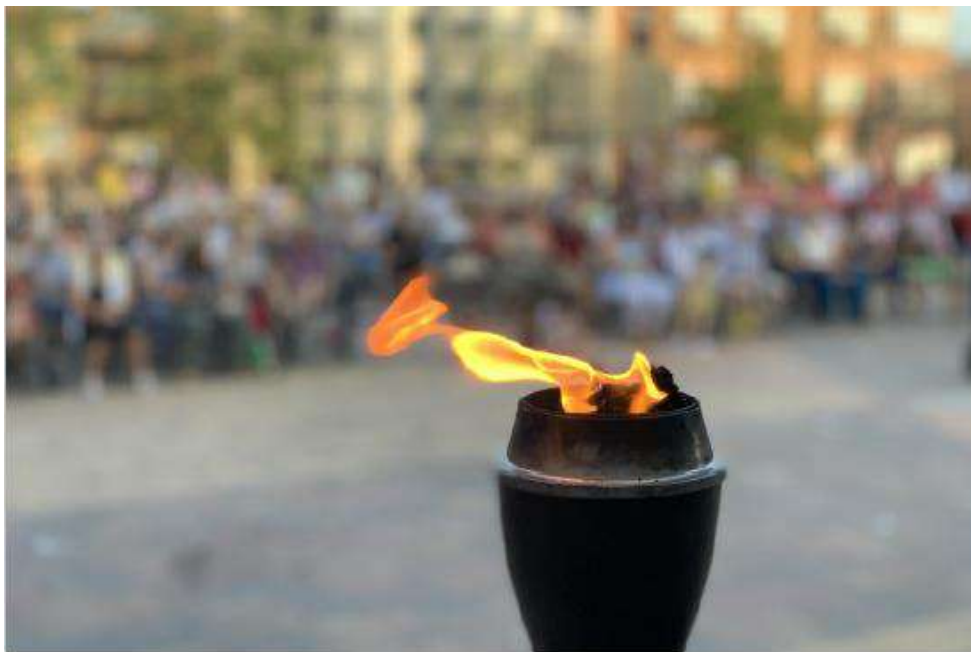
La flama del Canigó va presidir la celebració a la plaça d'El Mirador, per encendre les fogueres de Sant Joan