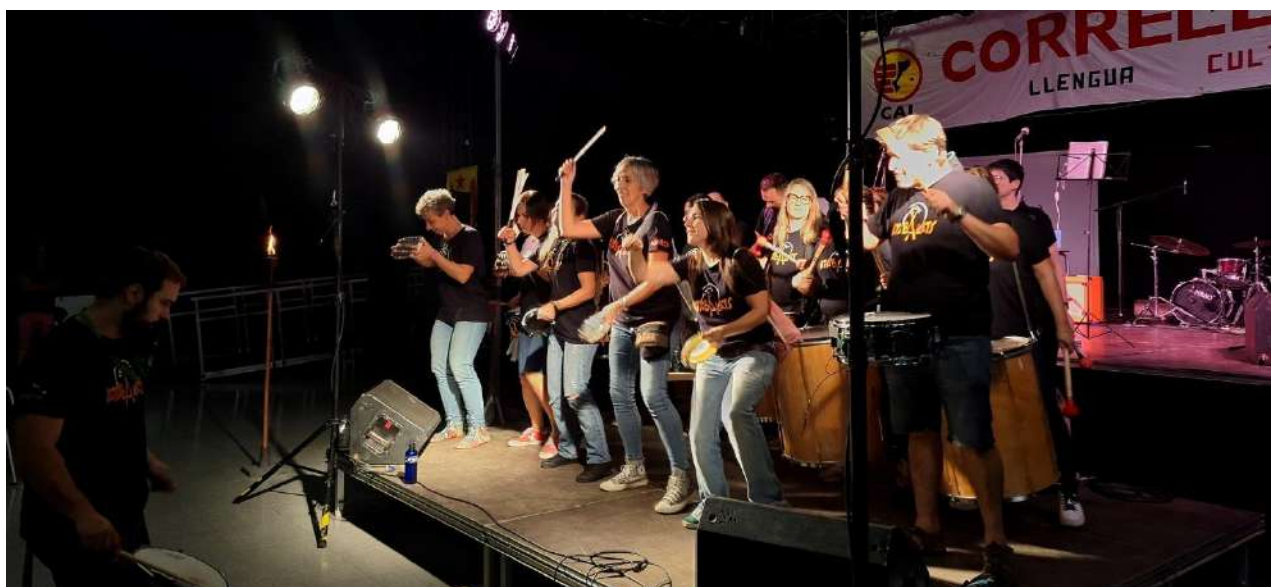
Arribada de la flama amb els Atabalats