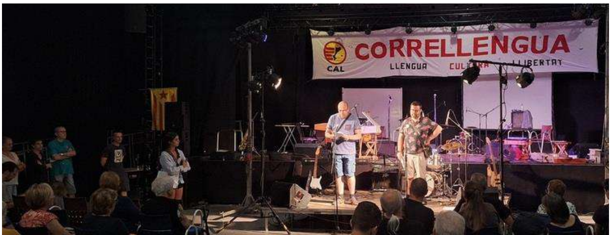
Presentació de l'acte i lectures per Suport Castellar