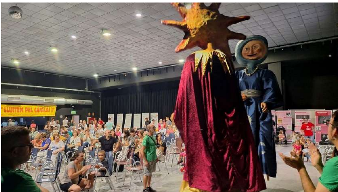
El Sol i la Lluna