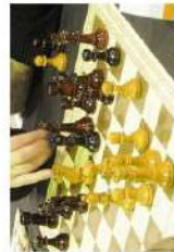
Club d'Escacs Castellar