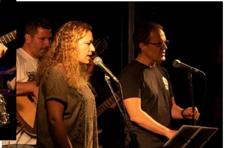
Walking to the Bar