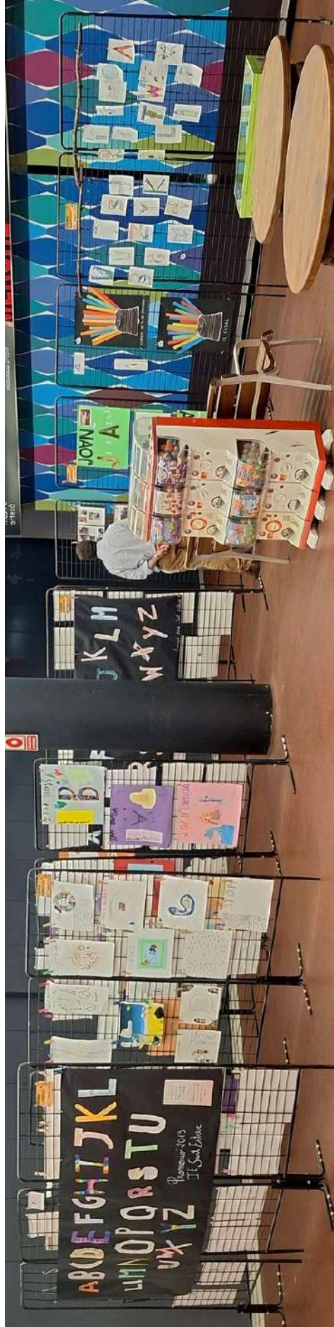
Exposició treballs sobre Joan Brossa – escoles Sant Esteve i El Casal