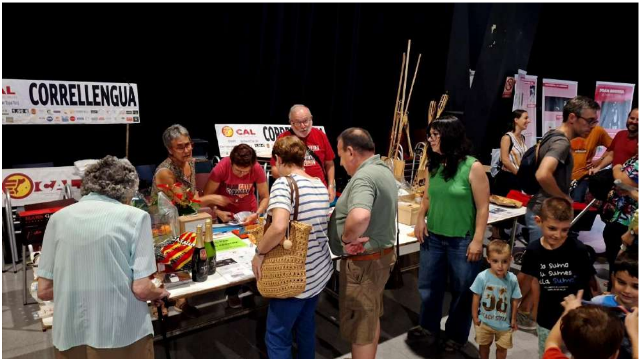
Benvinguts al Correllengua 2023