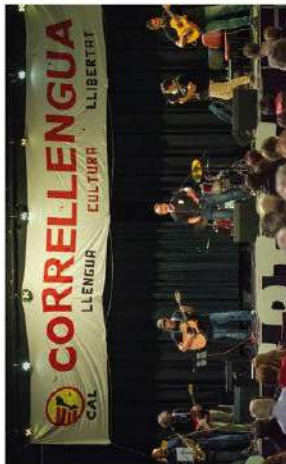
Walking to the Bar