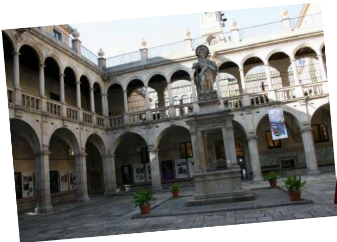
Institut d'Estudis Catalans

( http://www.bnc.cat/Visita-ns/Visites-guiades )