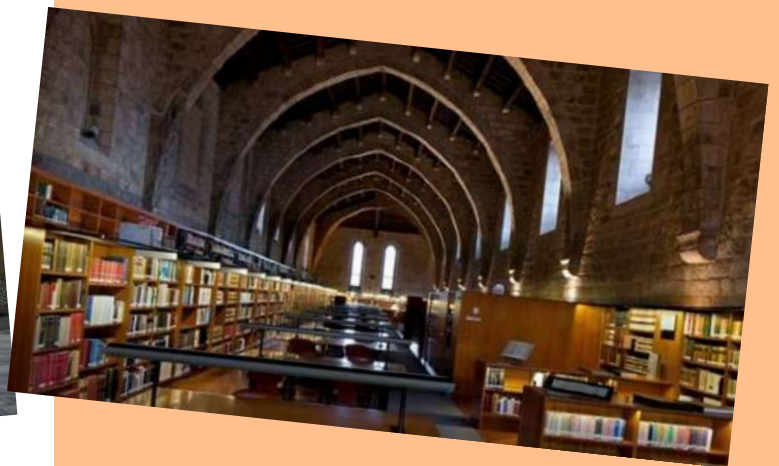
Biblioteca de Catalunya