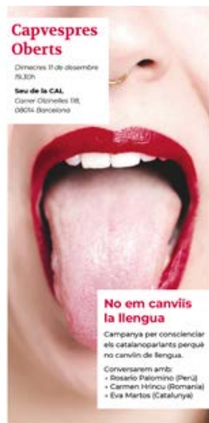
Cartell de l'edició No em canviis la llengua celebrada el desembre de 2019