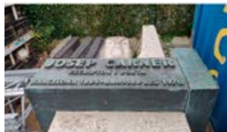
El Monument a Josep Carner a Brussel·les. FIEC. FEDERACIÓ INTERNACIONAL D'ENTITATS CATALANES

Enguany, el Correllengua ha tingut com a gran protagonista el poeta, periodista, autor de teatre i traductor català Josep Carner , commemorant el 50è aniversari del seu traspàs. Les seves obres el van situar com a capdavanter indiscutible de les noves promocions literàries, i la seva trajectòria va tenir tal rellevància que, fins i tot, hi ha erigit un monument dedicat a Carner. Actualment se li està buscant un nou emplaçament, però fins quatre anys enrere estava situat a la Universitat Catòlica de Lovaina, amb seu a Brussel·les, ciutat on va morir el 1970.