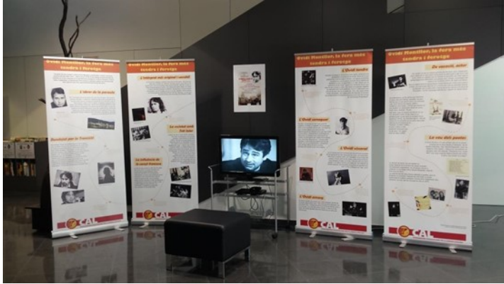
Mostra de l'exposició. Consta de 4 plafons autoenrotllables que poden col·locar-se en qualsevol espai. També està disponible en format lona per penjar.

El préstec és gratuït, tan sols es demana una quantitat simbòlica en concepte de fiança que és retornada un cop es retornen els materials.