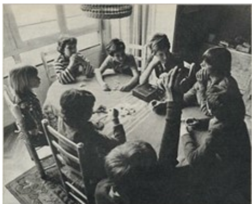
Imatge publicada al reportatge de la revista Triunfo .

L'any 1976 la revista Triunfo va publicar un reportatge de Montserrat Roig titulat "Los demócratas del mañana", en què reproduïa un debat amb nens i nenes d'entre 9 i 13 anys al voltant dels conceptes de democràcia, el poder, l'autoritat, els adults i la discriminació sexual.