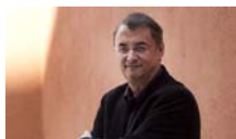
Avui és el dia de la sal