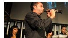
Comença el judici contra els dos policies que van agredir i amenaçar el dolçainer d'Obrint Pas