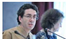
Les quadratures del cercle