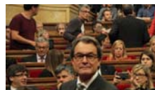
Els moments decisius d'una setmana històrica: què passarà d'avui a dijous?