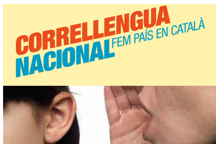
Cartell promocional del CLL andorrà

El Correllengua és des de fa sis anys ben present al Principat d'Andorra i enguany hi tornarà amb una doble jornada d'actes. El divendres, al Pas de la Casa , i de la mà del Centre d'Autoaprenentatge de Català s'han programat diverses activitats amb jocs de llengua i cultura (el joc d'Andorra, lliga d'scrabble i campionat d'embarbussaments) i amb berenar popular inclòs.