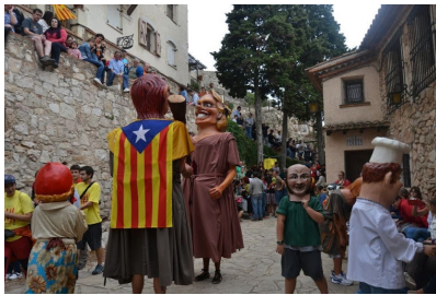
Gegants i capgrossos al CLL de Miramar

Consulteu l' agenda per a més informació.