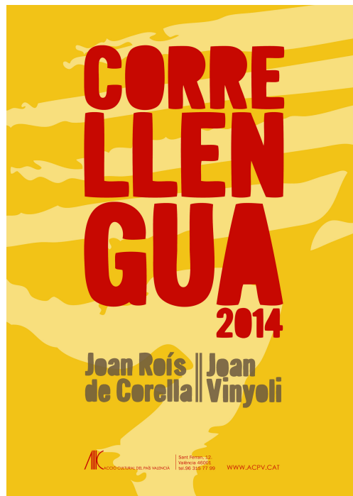
Imatge del cartell oficial del Correllengua al País Valencià

Per a més informació sobre els continguts i calendaris, feu un cop d'ull al web Correllengua 2014 al País Valencià .