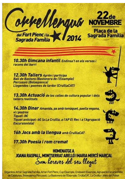
Imatge del cartell del CLL 2014 al Fort Pienc i la Sagrada Família

segueix-nos a Twitter | fes-te amic a Facebook | reenvia a un amic