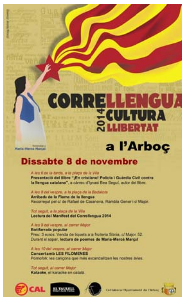
Cartells del Correllengua de Perpinyà i L'Arboç

CONSULTEU L'AGENDA DEL WEB DE LA CAL PER A ACTUALITZACIONS