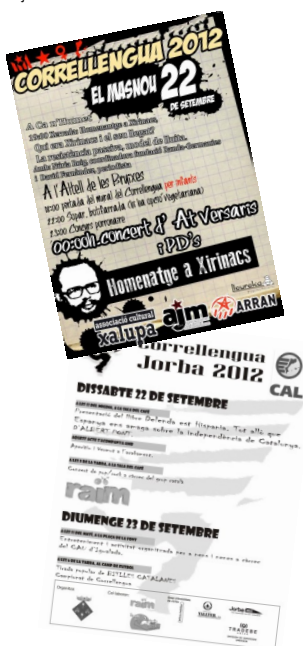
Cartells dels CLL del Masnou i Jorba

Paral·lelament a aquests actes, fins al diumenge 23 de setembre, continua oberta l'exposició "Realitat i vitalitat de la llengua catalana" al Museu de Cabrils (el Maresme) i a Artés (el Bages) s'inicien els actes del seu Correllengua que culminarà el proper cap de setmana. Com a aperitiu, l'agrupació Amics de la Sardana d'Artés ha preparat una audició de sardanes amb la Cobla Marinada (al parc de Can Crusellas, diumenge 23, 18:30h), mentre que a la Biblioteca s'inaugurarà l'exposició "Coneix Xirinacs" que es podrà visitar entre el 24 de setembre i el 6 d'octubre.