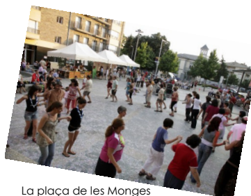
La plaça de les Monges de la Seu d'Urgell tornarà a allotjar el CLL