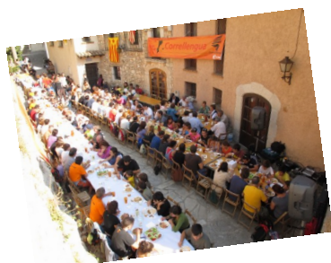
Imatge del CLL 2011 a Miramar

Un cap de setmana més, la flama del Correllengua recorre diverses comarques del Principat.