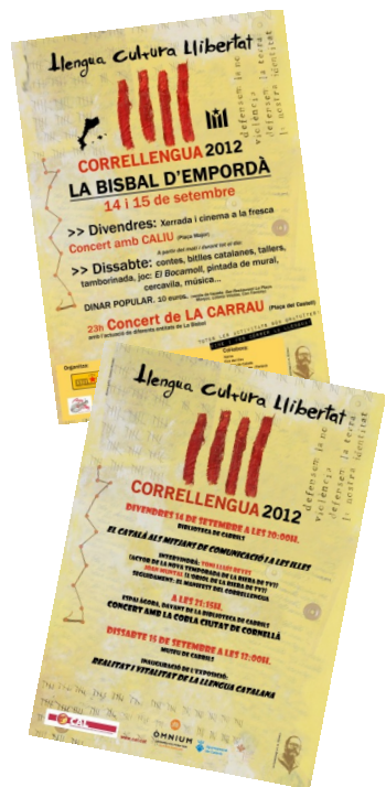
Cartells del CLL de la Bisbal d'Empordà i de Cabriels

Les viles de Corbins i Montoliu de Lleida (el Segrià) donaran continuïtat als seus actes de Correllengua iniciats durant la Diada. A Corbins , l'Associació Juvenil ha programat tota una jornada de dissabte 15 plena d'activitats. De bon matí, un retruc de campanes, un esmorzar popular i una mostra de cultura popular, que inclourà una actuació de la Colla Bastonera del Casal Popular l'Arreu de Mollerussa, iniciarà la jornada. Per la tarda serà el torn per als més menuts amb els contes de la Companyia Nopatiskos i la cercavila. Ja al vespre i al Poliesportiu, el sopar popular serà el preàmbul de la Nit de música en català, amb l'actuació de Mr. Freak Ska , la Terrasseta de Preixens i el PD Uri Roots. El mateix dissabte, a Montoliu de Lleida , la plaça de l'església acollirà els actes de Correllengua des de primera hora de la tarda, amb una mostra de jocs populars, una ballada de sardanes, balls de bastons, i una concorreguda cercavila que comptarà amb una bona representació de colles de diferents punts de la comarca: el Grup de Grallers i Puputs de Montoliu, El Griu d'Artesa de Lleida, el Bestiari d'Alcarràs i la Cobla de Sacaires de Sudanel. A partir de la mitjanit, la música de Republika Ska i Staklar clourà els actes.