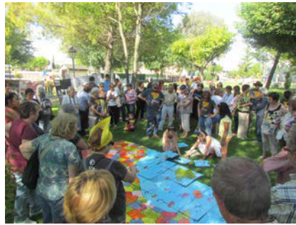
Inauguració del trencaclosques dels PPCC al CLL d'Ivrs d'Urgell

Entre els recursos més reeixits que s'ofereixen als organitzadors de CLL, el Trencaclosques dels Països Catalans és sens dubte dels que tenen més gran acollida.