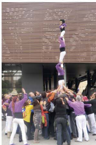
Pilar dels castellers de Figueres al Correllengua 2012

Si voleu col·laborar a fer del Correllengua figuerenc d'enguany el més reeixit de la història, només cal que entreu a aquest web .