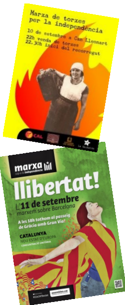
Cartells de la Marxa de Torxes a Alella (superior) i de la Marxa per la Independència a Barcelona (inferior)

Tots i totes ens hi juguem molt. No hi falteu!