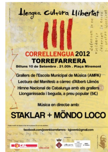
Cartell del CLL 2012 a Torrefarrera

Tots els detalls d'aquests Correllengües els teniu a l' agenda de la CAL .