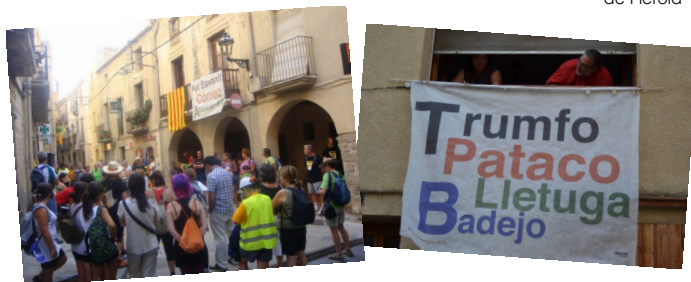
Dos moments del Correllengua d'Alforja