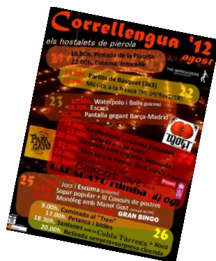
Cartell del Correllengua dels Hostalets de Pierola