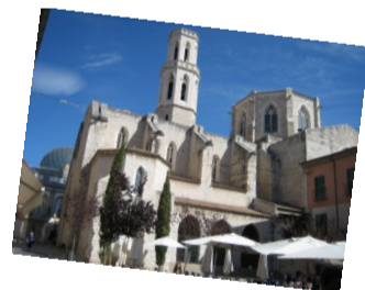
Figueres i Perpinyà, clouran el Correllengua 2012 el 10 de novembre