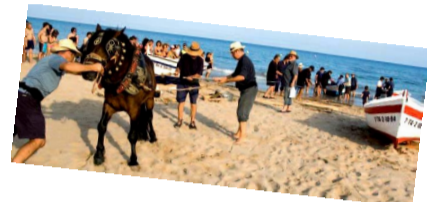
Imatges del cartell del Correllengua de Tarragona i de l'arrossegament de gussis, una de les atraccions dels actes programats a Torredembarra

Consulteu l'agenda de la CAL per a més detalls.