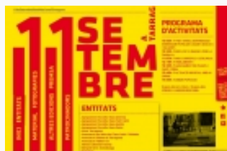
Web de la Coordinadora 11 de setembre de Tarragona

Gràcies a l'impuls de l'Assemblea Territorial de Gandesa, el Correllengua arribarà a l'octubre, per primer cop en molt de temps, a la Terra Alta. Des de la CAL animem a que altres entitats del Pla de l'Estany, la Cerdanya o la Garrotxa s'hi afegeixin ben aviat!