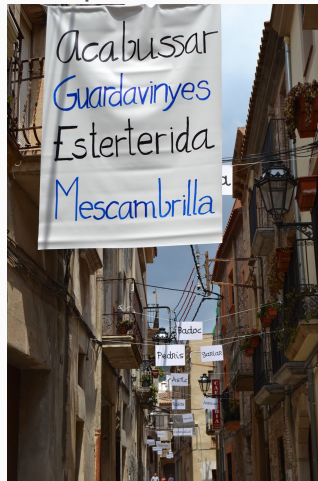
Imatge del CLL d'Alforja