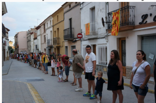
Cadena humana al CLL dels Hostalets de Pierola