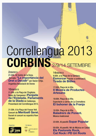
Cartell de proper CLL de Corbins

Només cal que que es subscriuguin a través d' aquest enllaç , o bé fer ús de l'opció "reenvia a un amic" que trobareu al peu d'aquest butlletí.