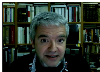
Màrius Serra, l'autor del Manifest del Correllengua 2012

Com és tradició, la CAL encarrega l'elaboració del Manifest del Correllengua a una persona de reconegut prestigi i que s'hagi significat per la seva posició en favor de la llengua, la cultura i el país. Enguany, l'escriptor i enigmista Màrius Serra va acceptar gustosament el repte de redactar-lo i no ha decebut gens en el seu intent.