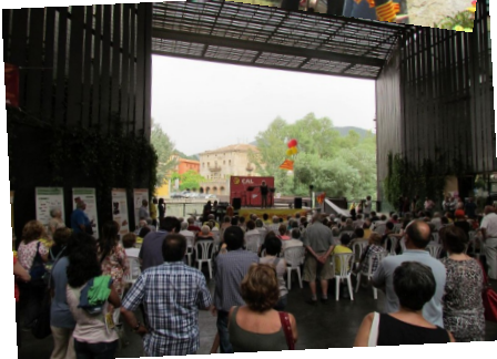
Diversos moments de l'inici del Correllengua 2012, pla de Can Pegot i plaça de la Lira