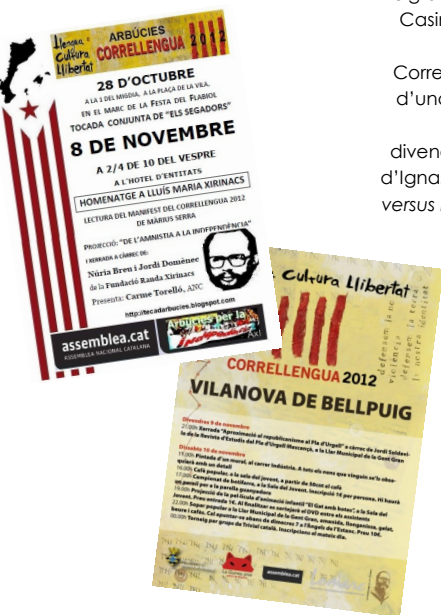
Cartells dels CLL d'Arbúcies i Vilanova de Bellpuig