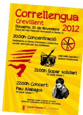
Cartell del CLL 2012 a Crevillent

Malgrat que el Correllengua 2012 s'acomiada oficialment aquest proper cap de setmana, en dies posteriors altres viles s'han engrescat a organitzar activitats. Aquest és el cas de Vandellòs (el Baix Camp), Arbeca (les Garrigues), Arenys de Mar , Canet de Mar i Tiana (el Maresme), Terrassa (el Vallès Occidental) i L'Hospitalet de Llobregat (el Barcelonès). Podeu consultar el programa d'activitats a través del nostre web.