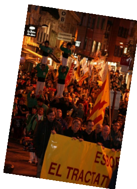
Manifestació al CLL de Perpinyà l'any 2011