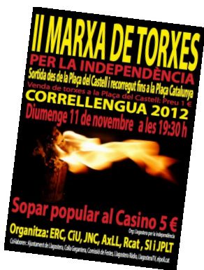
Cartell de la Marxa de Torxes, al CLL de Llagostera