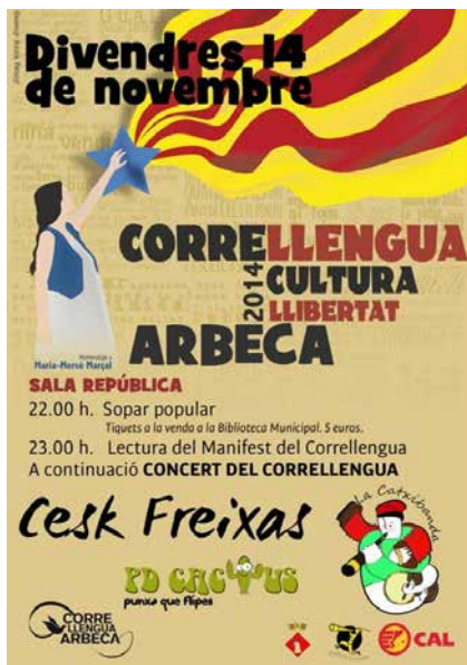
Imatge del cartell del CLL 2014 a Arbeca

segueix-nos a Twitter | fes-te amic a Facebook | reenvia a un amic