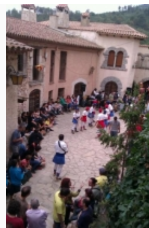
Imatge del CLL 2012 de l'Alt Camp, a Miramar