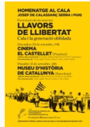
Cartell informatiu sobre l'homenatge a en Cala

segueix-nos a Twitter | fes-te amic a Facebook | reenvia a un amic