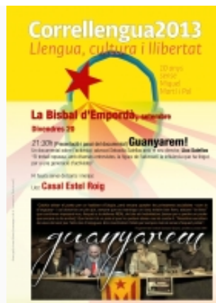
Cartell del CLL de la Bisbal d'Empordà