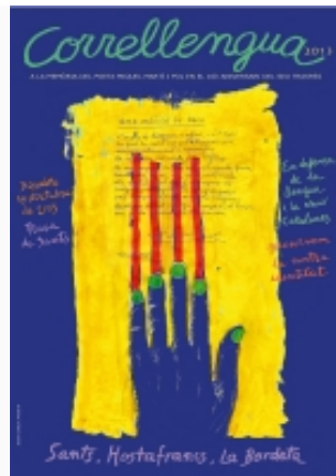
Cartell del CLL 2013 de Sants, Hostafrancs i la Bordeta