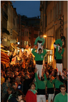
Els castellers d'Aire Nou de Bao acompanyaren amb diversos pilars el pas de la manifestació