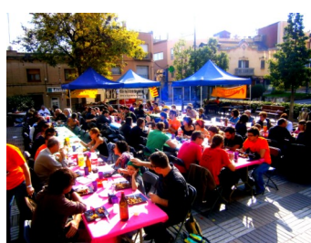
Sant Vicenç dels Horts celebrà amb una arrossada el pas del Correllengua