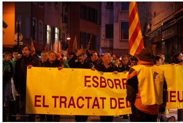
El lema "Esborem el Tractat dels Pirineus" encapçalà el recorregut de la manifestació

Any 2 - Número 10 - Novembre 2011 - 3a setmana