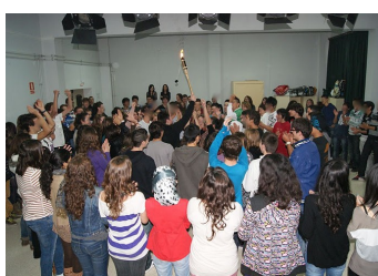
Arribada de la flama del Correllengua a l'IES Quartó de Sant Antoni de Portmany