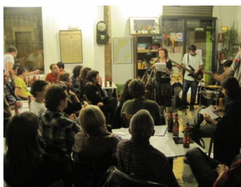
El Casal Can Capablanca de Sabadell va acollir l'Estramp Jam