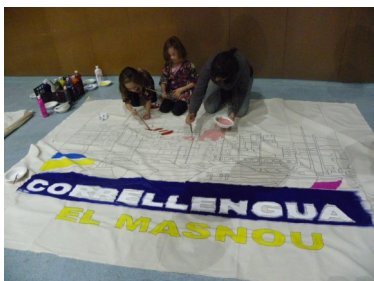
Pintada d'un mural commemoratiu al Correllengua del Masnou