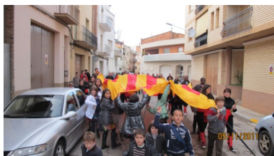
Cercavila popular al Correllengua d'Alguaire