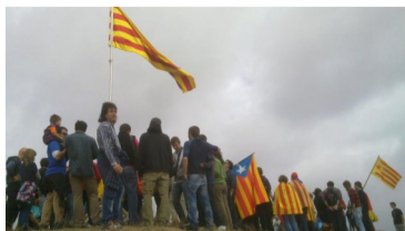
Plantada de la senyera al Castell del Mor, al CLL de Tàrrrega