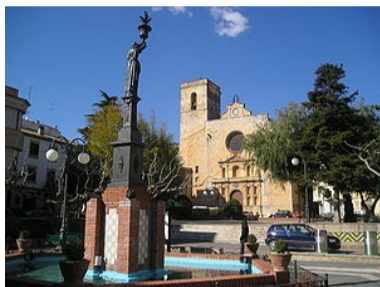
Un any més el Correllengua va recórrer els carrers i places de Riudoms