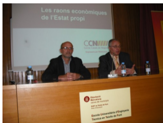
Les raons econòmiques per un estat propi, temàtica de la xerrada del CLL de Canet de Mar

Fora del Principat, Eivissa continuà celebrant el pas de la flama de la llengua, mentre que al Rosselló la vila de Bao escalfà motors per als actes de Perpinyà, amb les Diades Airenovenques que es van viure de divendres a diumenge, malgrat la pluja que va fer suspendre alguns dels actes previstos. A Rià i Prada de Conflent , també es va viure el pas del Correllengua el dissabte 29 amb una sortida a peu des de l'església de Rià i fins a l'Ajuntament de Prada, on es va llegir el manifest del Correllengua.