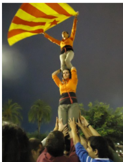
Un pilar va rebre la flama de la llengua al CLL de Sitges