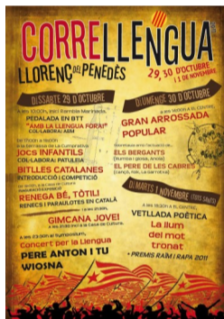
Cartell del CLL de Llorenç del Penedès