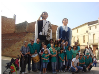
Els grallers i gegants de Montoliu de Lleida varen desvetllar als més gansoners

Com ja és habitual, Santa Margarida de Montbui (Anoia) va concentrar els actes del Correllengua dins del primer dissabte de setembre. La plaça Major va acollir bona part de les activitats programades, amb especial protagonisme dels més menuts en les activitats de tarda: xocolatada, narració de contes, pintades de murals i jocs els van tenir ben entretinguts. Al vespre, el plat fort va venir de la mà de l'actuació del popular grup Els Catarres que varen aconseguir omplir la plaça de gom a gom.