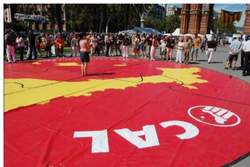
El mosaic dels PCC serà present a l'acte de presentació del Correllengua a Barcelona

En motiu de la festivitat de la Diada Nacional de Catalunya a la ciutat de Barcelona, i en el marc de la 10a Fira d'Entitats dels Països Catalans , la CAL serà protagonista d'un breu acte de presentació del Correllengua 2011. Seguint el guió d'altres anys, s'iniciarà la celebració amb la lectura del Manifest d'enguany i l'encesa de la flama. Tot seguit, es desplegarà el mosaic dels Països Catalans com a símbol de la unitat i pervivència de la llengua, i que servirà de preàmbul a l'actuació dels Castellers de Sant. L'acte se celebrarà al voltant de les 13:00h, al capdamunt del Passeig Lluís Companys. Durant tota la jornada la CAL tindrà presència a la fira d'entitats amb una parada més àmplia que en anys anteriors i on es podrà visitar, entre d'altres elements, l'exposició sobre el Correllengua i sobre Joan Oliver, l'autor que es recorda aquest any.