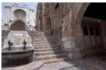
La plaça de les Cols eix dels actes de la Diada a Tarragona

Aquest any però, la CAL i el Correllengua també seran presents als actes de celebració de la Diada a la ciutat de Tarragona. Convidats per la Coordinadora 11 de setembre de Tarragona , la CAL interindrà en un breu parlament que es centrarà, sobretot, en fer un repàs de l'estat de la llengua catalana al conjunt dels Països Catalans. Aquest acte tindrà lloc a la plaça de les Cols de la ciutat, a partir de les 12:00h. També en aquesta ocasió es podrà visitar una parada de productes i serveis que ofereix la CAL.