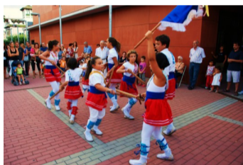
Imatge del CLL as Hostalets de Pierola

Després de la pausa que va abraçar bona part del mes d'agost, el Correllengua ha reiniciat el seu recorregut per les comarques dels Països Catalans.