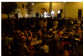
La plaça Major de Sta. Margarida de Montbui durant l'actuació dels Catarres