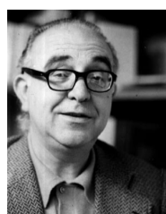
Valor i Sanchis Guarner, protagonistes del Correllengua al País Valencià