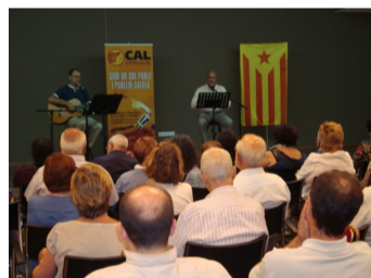
Dos moments del CLL d'Esplugues de Llobregat