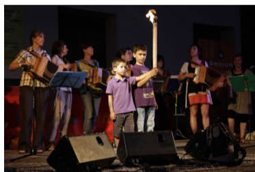
Entrada de la flama acompanyada dels acords de "Les Dones Acordionistes i Percussionistes del Pirineu"