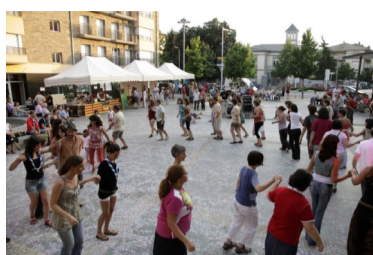
Taller de danses al Correllengua de la Seu d'Urgell

L'edició d'enguany del Correllengua a la Seu d'Urgell va ser impulsada per la secció local d' Òmnium Cultural , amb el suport de l'Ajuntament de la Seu d'Urgell i de la CAL, entre d'altres entitats.