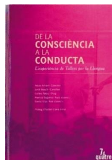
De la consciència a la conducta , diversos autors (7dquatre, 2009)