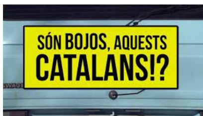
Són bojos, aquests catalans!? , de David Valls Documental (2013) de 70', a Youtube.com