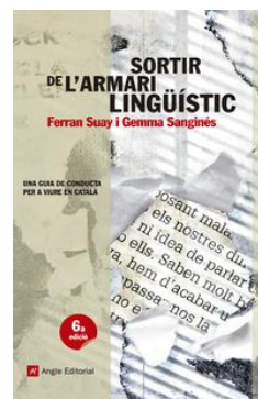
Sortir de l'armari lingüístic. Guia de conducta per viure en català , de Ferran Suay i Gemma Sanginés (Angle Editorial, 2010)