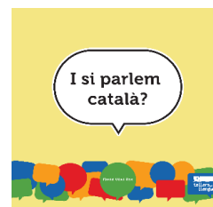
I si parlem català? , de David Vila (Tallers per la Llengua, 2016)