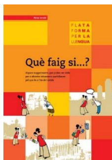
Què faig si...? , guia didàctica (Plataforma per la Llengua, 2017)