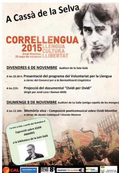
Cartell del Correllengua de Cassà de la Selva

reprendrà l'organització del Correllengua amb una munió d'activitats el mateix dissabte, des de les 10h del matí, amb xocolatada, pintada del mural commemoratiu, dinar popular, activitat castellera i concert de Xento entre els actes més reeixits.