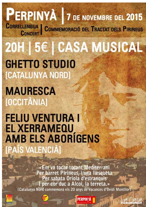
Cartell oficial del CLL 2015 de Perpinyà