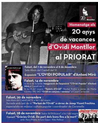
Cartel del CLL del Priorat

A l' Arboç de nou recordaran Ovidi amb un ampli cartell d'actes dels que destaquem l'enlairament de paraules dirigida als més menuts, i el concert de Verd Cel . A Avià també la faran grossa el 21 de novembre amb el concert de la Terrasseta de Preixens .