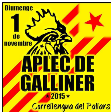
Cartells dels CLL de Tàrraga i del Pallars