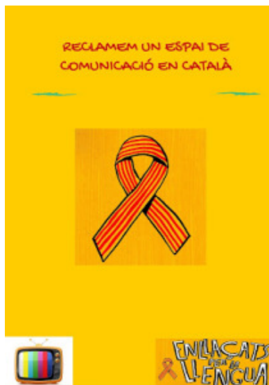
Cartell de la campanya per un espai de comunicació en català

Enllaçats per la Llengua ha impulsat recentment un manifest en què es reclama, entre d'altres, que es repreguin les emissions de la CCMA (Corporació Catalana de Mitjans Audiovisuals) i IB3 a tots els territoris de llengua catalana, que es recuperin les emissions de la ràdio i la televisió valencianes i que totes