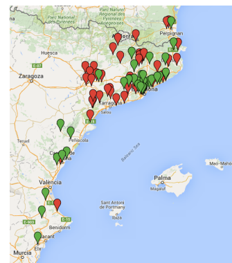
Mapa del CLL2015

CONSULTEU L'AGENDA DEL WEB DE LA CAL PER A ACTUALITZACIONS