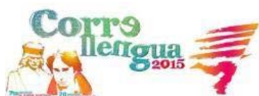
Correllengua 2015 al País Valencià

Enguany no és una excepció i bona part dels actes previstos tindran lloc les properes dues setmanes, emmarcades en activitats que involucren especialment les escoles i els instituts. Aquest és el cas de les viles de Castelló de la Plana, Betxí, Benicàssim, Sant Mateu i Morella , que entre el 30 de setembre i el 3 d'octubre celebraran activitats diverses. A destacar el fet que per primer cop la flama de la llengua serà rebuda per la corporació municipal de la capital castellanenca, signe del canvi polític que comença a evidenciar-se.