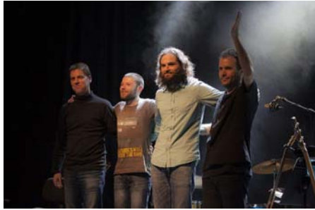
El grup Verd Cel protagonista del CLL a Gandia

La ciutat de Gandia (la Safor) és tradicionalment un dels primers Correllengües del calendari al País Valencià. Enguany ho torna a ser i amb una forta càrrega de record a Ovidi Montllor. Els actes tindran lloc a la plaça Rei Jaume I, el dissabte 26 de setembre, iniciant-se amb una cercavila de dolçainers, tabalers i muixeranguers i es clourà amb el concert-homenatge a Ovidi de Verd Cel i l'actuació de la nova formació saforenca Deliri .