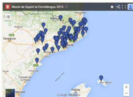
Mapa de suport al Correllengua 2015

Des de la CAL fem una crida als grups municipals perquè presentin el text en les properes convocatòries del ple, si és que encara no ho han fet.