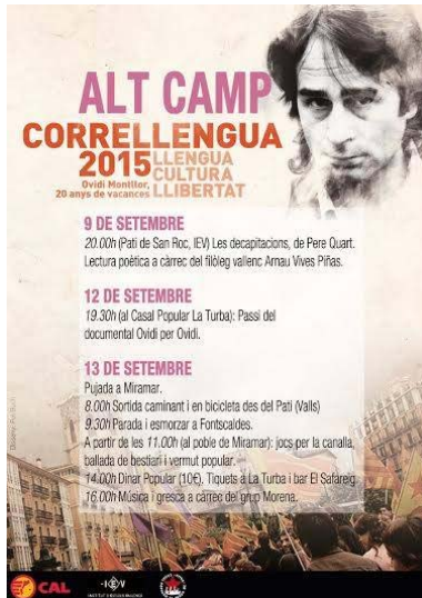
Cartells dels CLL de Torredembarra (esquerra) i l'Alt Camp (dreta)