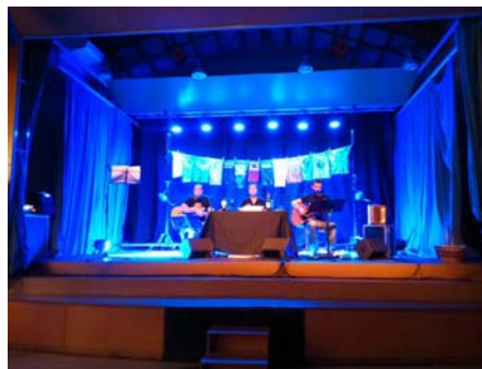
Imatge del concert d'homenatge a Ovidi al Cub de Capçanes

Tot i tractar-se dels mesos tradicionalment amb menys activitat, el Correllengua 2015 no s'ha aturat pas durant l'agost i el juliol i, de fet, ha estat l'any que s'hi han celebrat més activitats.