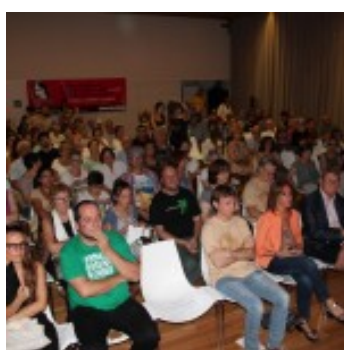
La sala de la Violeta, plena