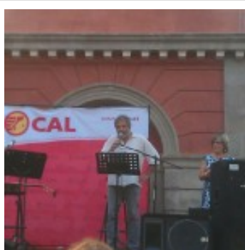
Intervenció de Som Països Catalans i la xarxa de Casals i Ateneus