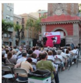
La plaça de la Vila de Gràcia, amb força públic