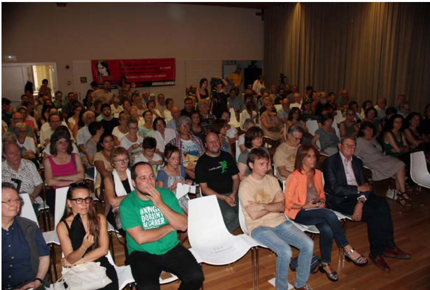
Aspecte general de l'auditori de La Violeta