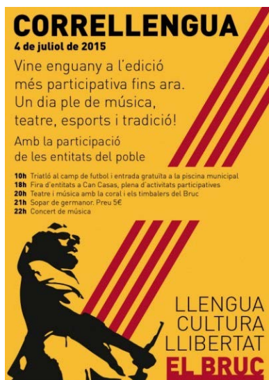
Imatge del cartell del CLL 2015 al Bruc

Independència amb una cercavila popular i el concert de la cantautora Marina Ràfols.