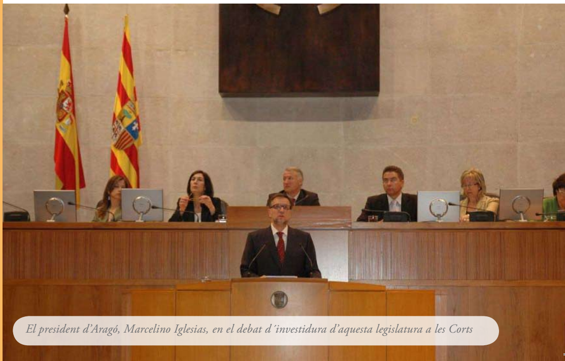
El president d'Aragó, Marcelino Iglesias, en el debat d'investidura d'aquesta legislatura a les Corts

Quina és la situació política davant el procés? L'aritmètica no assegura al PSOE la votació de la Llei. A l'hora de negociar-la, els números de la majoria simple necessària no surten perquè el PSOE, avui, no té cap vot encara garantit: IU i la CHA s'ho faran guiar i el soci del govern, el PAR, ja ha fet saber que no la votarà, que s'hi abstenirà, perquè podria ferir susceptibilitats