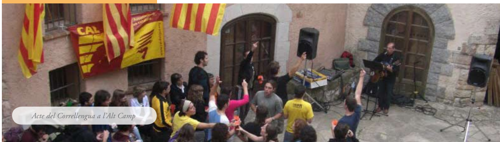
Acte del Correllengua a l'Alt Camp