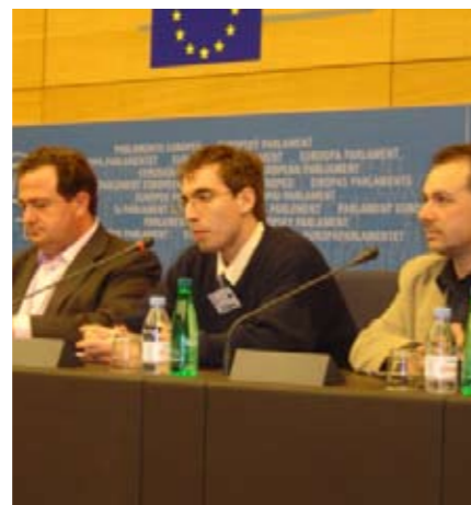
L'Institució Cultural de la Franja de Ponent quan va denunciar la situació del català al Parlament Europeu.